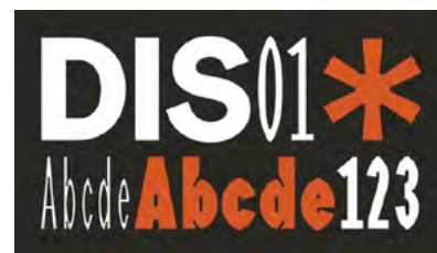
„DIS01 – Die Schrift, die verschwindet“ / Fabian Kolar / Hochschule RheinMain / [Bronze im] ADC Talent Award 2024